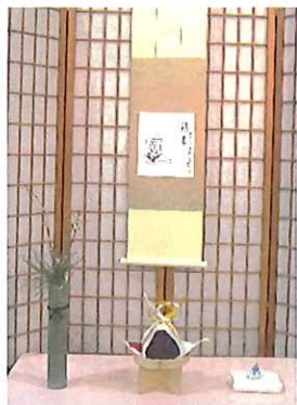
《掛け軸》 「宝船・福来たる」

新しい年を迎えて初めてのお茶会。小学校入学を控えている子ども達にとって、色々な楽しい事や嬉しい事がありますようにとの願いが込められています。