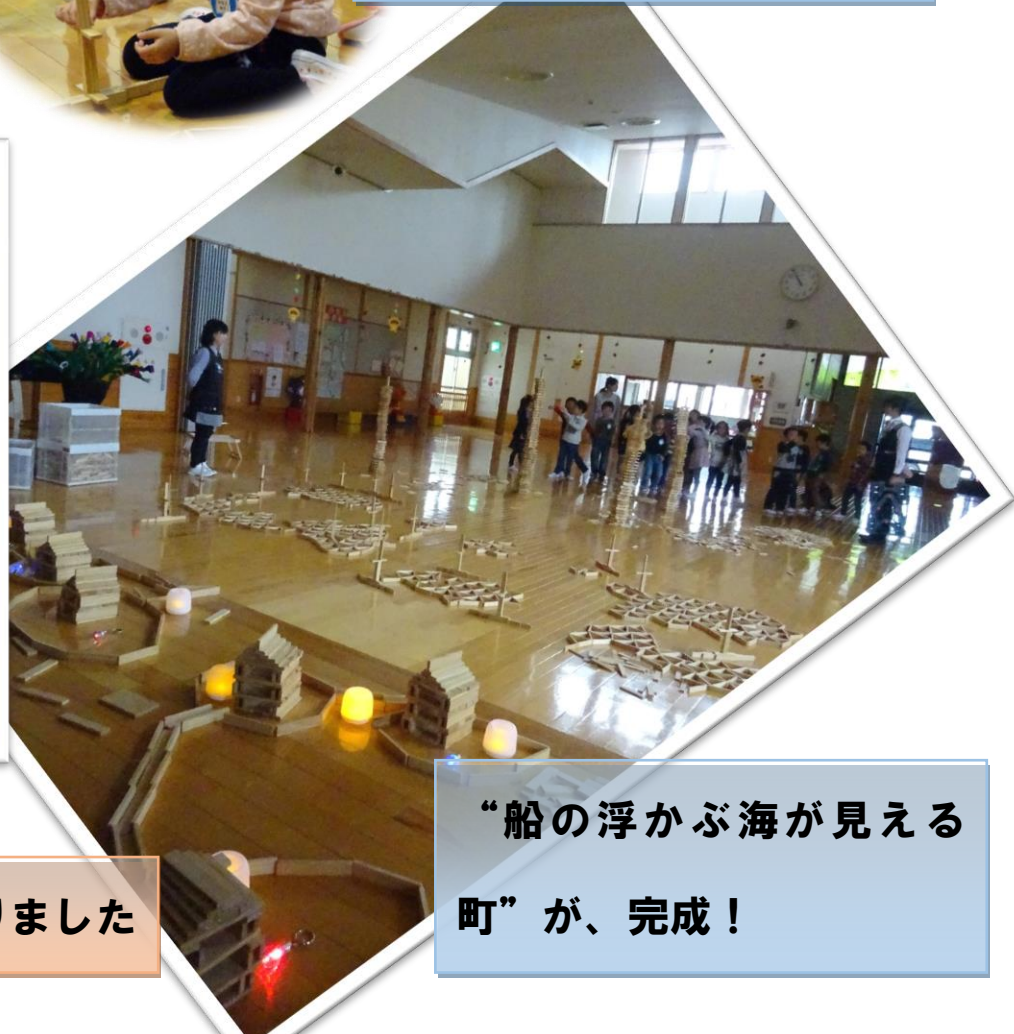
“船の浮かぶ海が見える町”が、完成！