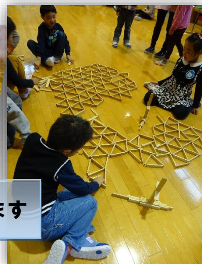
三角を作り、つなげて“海”を作ります