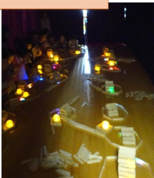
お家を道でつなぐと、大きな町になりました