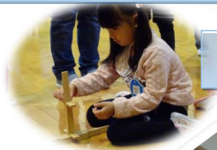
“海”には船も浮かびました