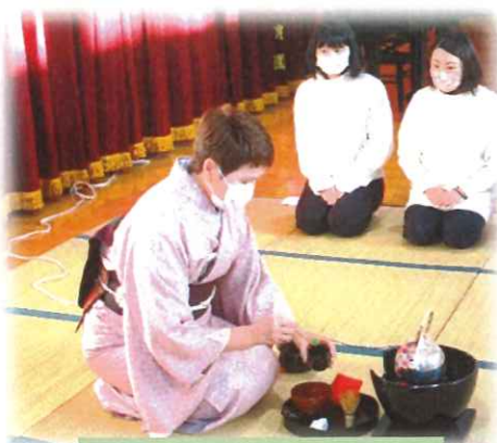
植田先生のお点前拝見