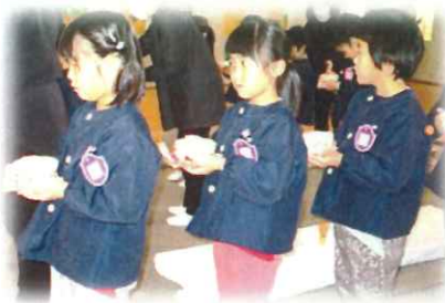
子ども達からお家の方への感謝のお茶運び