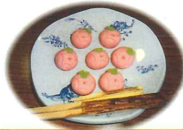
可愛らしいアサガオの練切です

今日はとても暑いですね。少しでも涼しく感じてもらえたらと思い、ガラスの香合を準備しました。