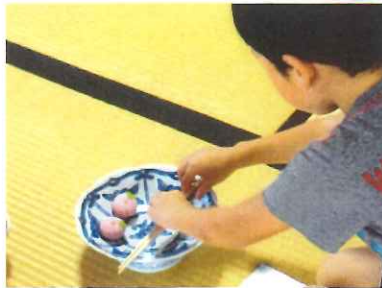
お箸の使い方も上手になってきました