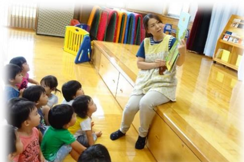
新しい絵本を読み聞かせしてもらおう2歳児