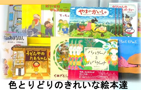
色とりどりのきれいな絵本達