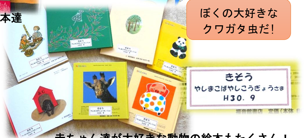
きぞう やしまこばやしこうぎょうさま H30. 9